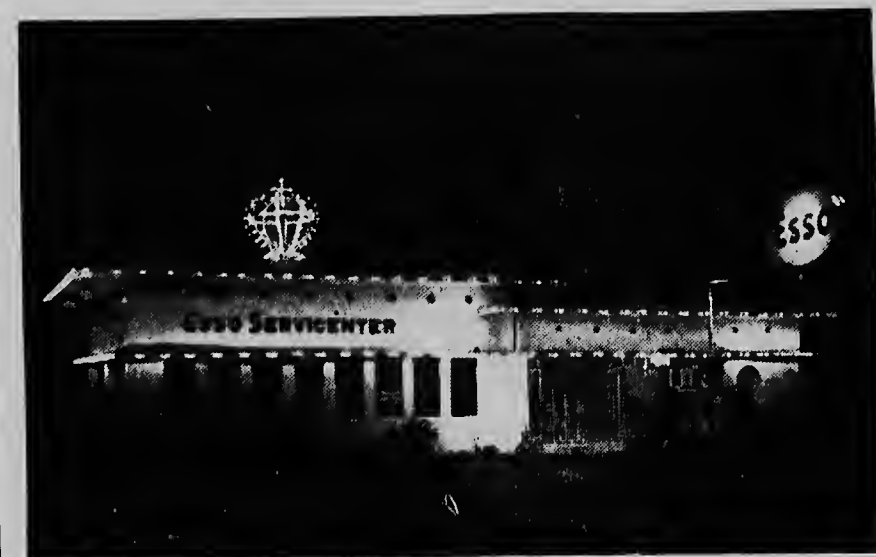
Het prachtig geillumineerde Esso Servistation in de Maria Christinastraat in Oranjestad. Vooral de kroon op het dak is een prachtig stuk werk.